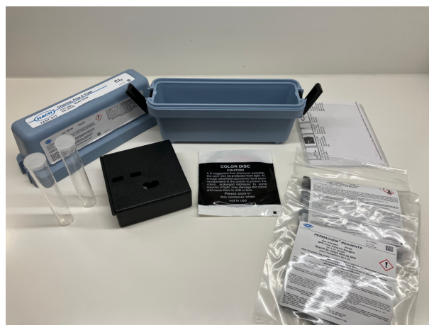
Figur 2 - HACH Chlorine (free & total) colour disc test kit