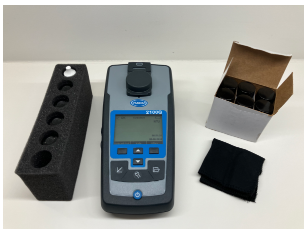
Figur 3 - HACH 2100Q Turbidimeter