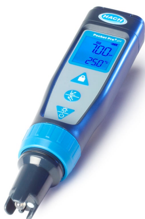
Figur 1 HACH Pocket Pro+ pH